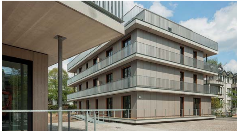
Ansicht Haus 2 von der Loggia Haus 3