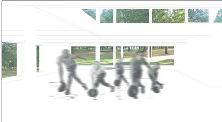
Ansicht Studio EG mit Ausblick in den Park