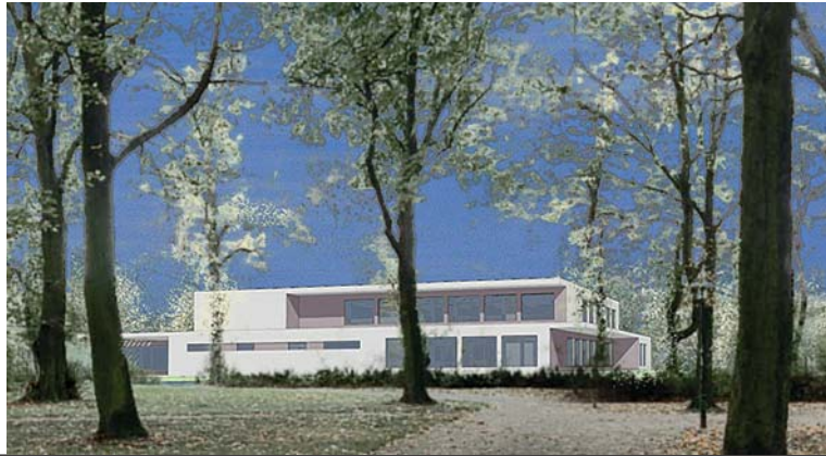
Ansicht vom Park