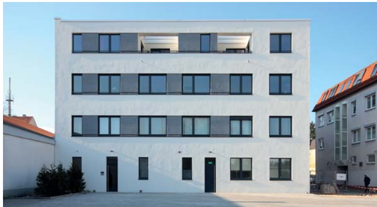
Ansicht vom Hof