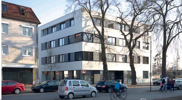
Ansicht von der Straße